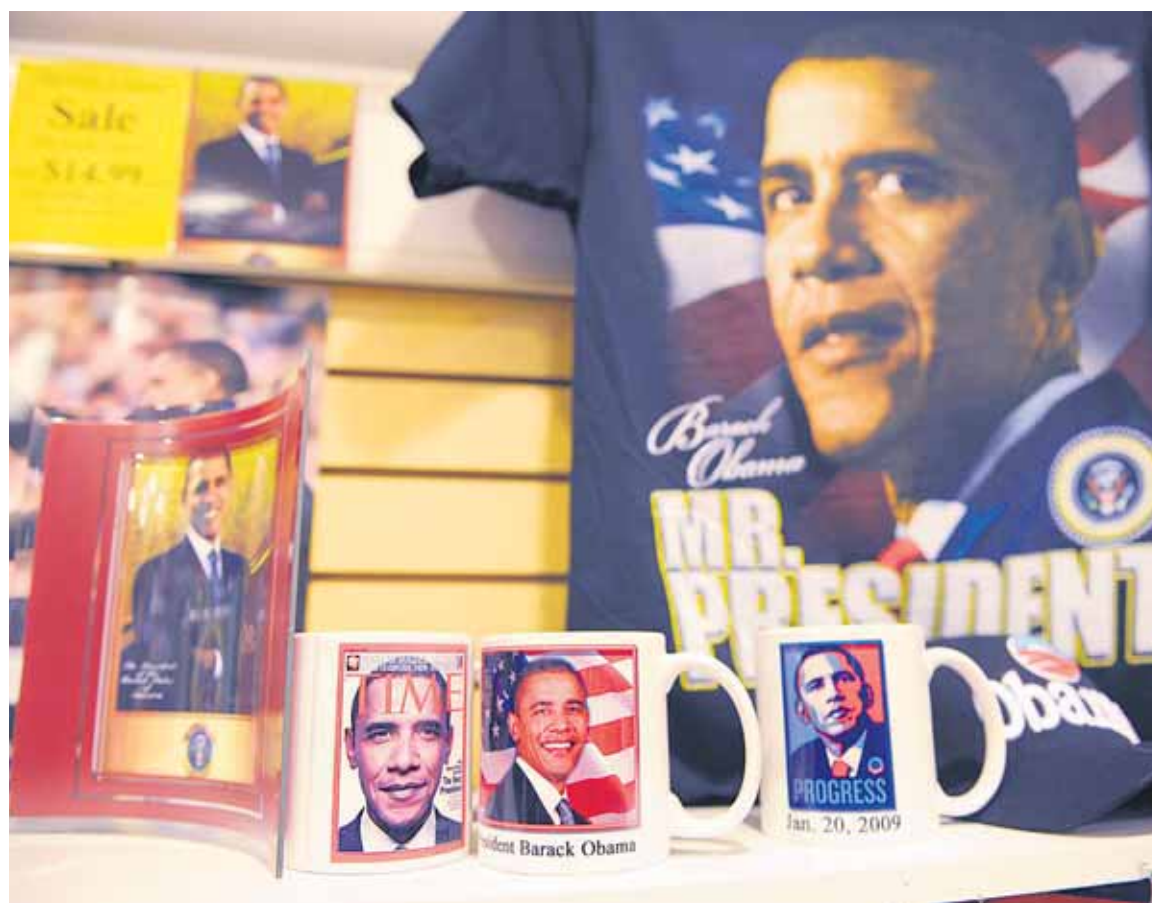
FIESTA. Una verdadera efervescencia cívica se vive en Estados Unidos con la asunción de Barack Obama.

NO PODEMOS DEPENDER SOLO DEL GOBIERNO PARA CREAR TRABAJOS O CRECIMIENTO A LARGO PLAZO (...) PERO EN ESTE MOMENTO ESPECIAL SOLO EL GOBIERNO PUEDE PROVEER DEL IMPULSO NECESARIO A CORTO PLAZO PARA LIBRARNOS DE UNA RECESIÓN PROFUNDA Y SEVERA.