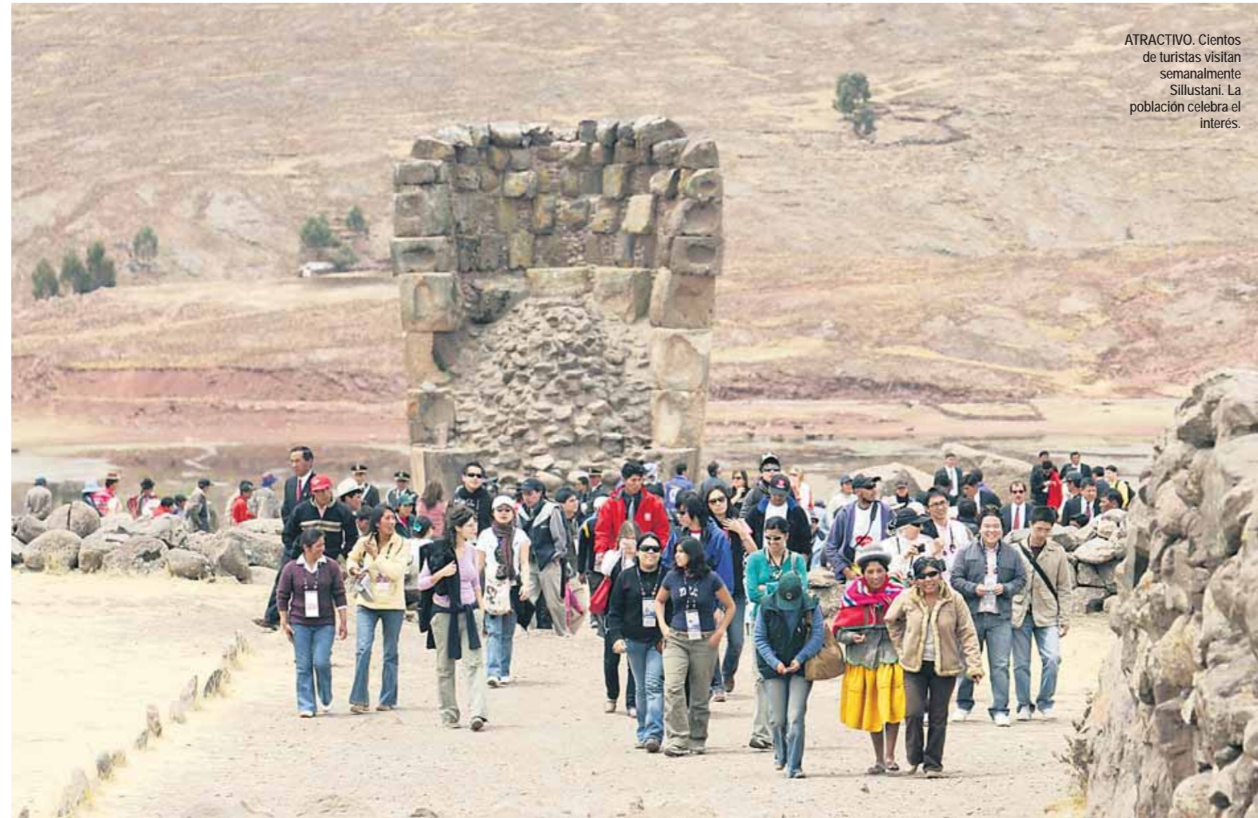
ATRACTIVO. Cientos de turistas visitan semanalmente Sillustani. La población celebra el interés.

Son aproximadamente 40 los kilómetros que distan entre la ciudad de Puno y el distrito de Atuncolla. El trayecto entre uno y otro punto es algo largo