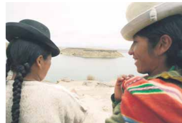
BELLEZA. Desde Sillustani se puede apreciar la laguna de Umayo, un lugar que seduce por su tranquilidad.