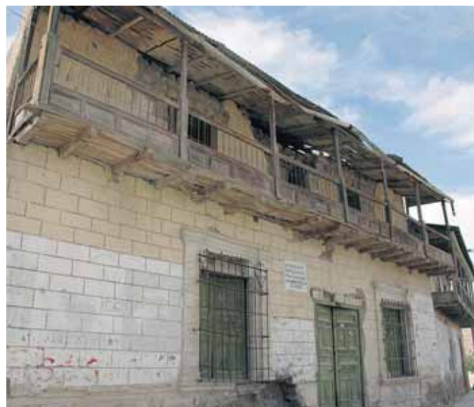
HISTORIA. Existen leyendas que cuentan relatos de la casa embrujada de Torata.