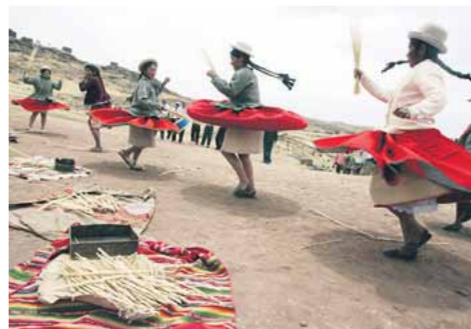
FOLCLOR. La música en Puno forma parte de la gran riqueza cultural de esa región.

Es precisamente en la actividad agrícola en la que los pobladores de estas tierras también expresan su tradición y alegría mediante danzas como la de Quinuahuajta, que realizan mientras siembran la quinua, y la de Tarpuy, ejecutada durante la siembra de otros cultivos. Una muestra adicional del encanto especial que guarda esta parte del Perú y su gente