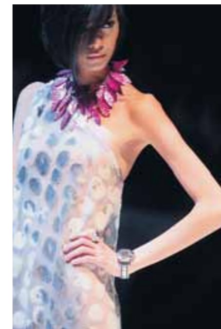
DESFILE. Feria Internacional de la Moda / Perú Moda 2008. FOTO: Piero Vargas, 2008.