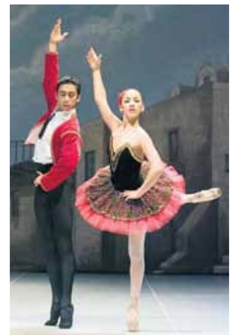
GALA. Una escena de Don Quijote , por el Ballet Municipal de Lima. FOTO: Alberto Orbegoso, 2008.