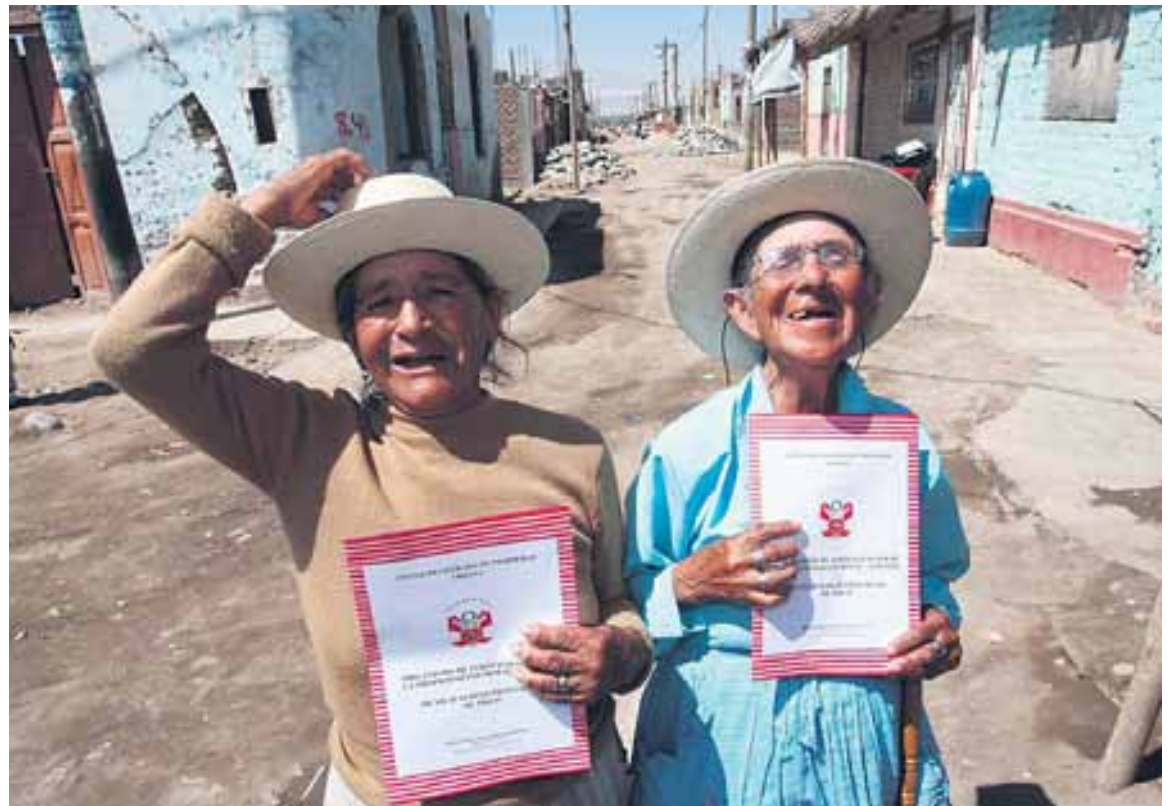
ALEGRÍA. Damnificados beneficiados con títulos de propiedad del centro poblado de Bernales, distrito de Humay (Ica). FOTO: Jack Ramón, 2008.