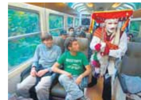
TURISMO. Tren de lujo Hiram Bingham en la ruta Cusco-Machu Picchu. FOTO: Alberto Orbegoso, 2008.