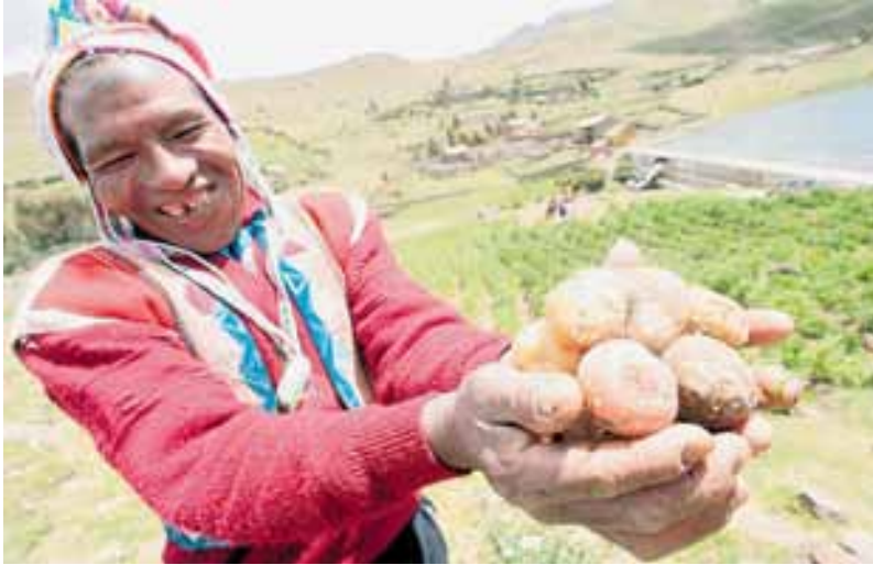
PAPA. Comunero de Paruparu, provincia de Calca (Cusco), muestra orgulloso la variedad del producto en el Año Internacional de la Papa. FOTO: Carlos Lezama, 2008.