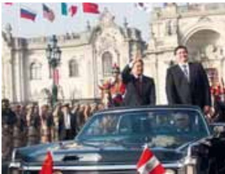
VISITA. El presidente Alan García Pérez y su homólogo de China, Hu Jintao.

LA SELECCIÓN FOTOGRÁFICA MUESTRA, POR EJEMPLO, LAS ACTIVIDADES REALIZADAS EN LAS DOS CUMBRES DE LAS QUE EL PERÚ FUE ANFITRIÓN –ALC-UE Y APEC–. TAMBIÉN PRESENTA LOS DIVERSOS ROSTROS DE NUESTRA CULTURA; OTRO ASPECTO IMPORTANTE SON LOS TRABAJOS QUE SE REALIZAN EN LOS SECTORES MÁS POBRES DEL PAÍS.