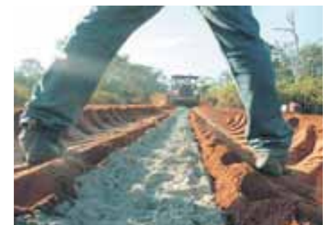
DESARROLLO. Las obras en la Interoceánica sur en Madre de Dios siguen adelante. FOTO: Jack Ramón, 2008.