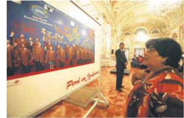
EXPOSICIÓN. En su primer día de exhibición en Palacio de Gobierno, la muestra atrajo el interés de miles de visitantes.

Dos años de intensa labor resumidos en esta importante exposición que recoge los mejores trabajos elaborados por el equipo de fotoperiodistas del Diario Oficial El Peruano y la Agencia de Noticias Andina . La muestra se lleva a cabo en el salón Dorado del Palacio de Gobierno. Para no perdérsela.