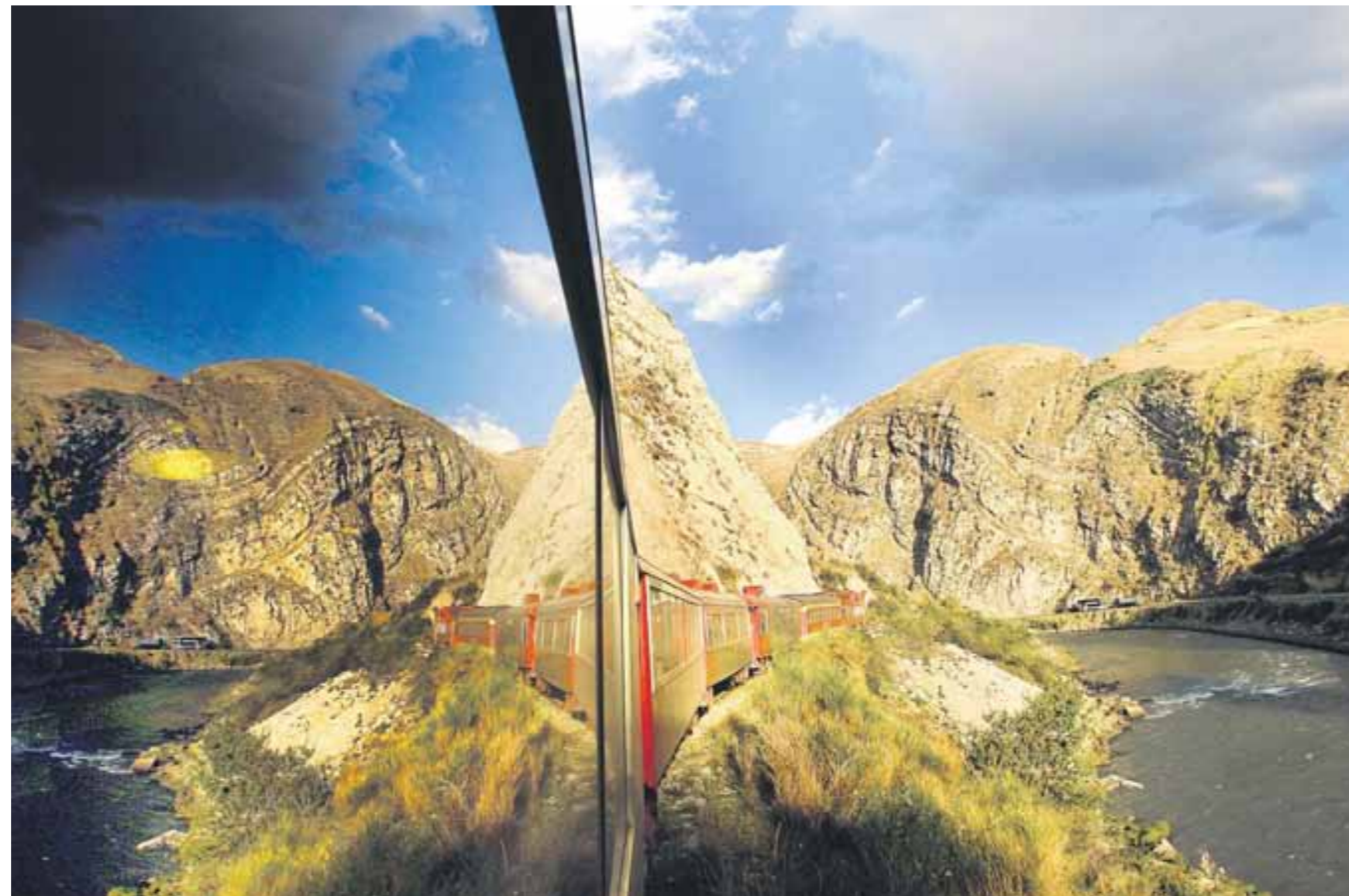
CIRCUITO. El maravilloso paisaje de la sierra central se descubre al paso del ferrocarril Lima-Huancayo. FOTO: Alberto Orbegoso, 2007.