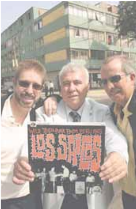
NUEVA ETAPA. Los Saicos en su versión del siglo XXI, tras sobrevivir a numerosas leyendas urbanas.

RETORNO. La leyenda de Los Saicos creció llena de mitos hasta que en 1999 la imposibilidad de acceder a sus canciones terminó con la edición en España del disco Wild teen punk from Peru 1965 . A la derecha, el grupo en un momento de relax, en el bowling de Miraflores, en octubre de 1965.