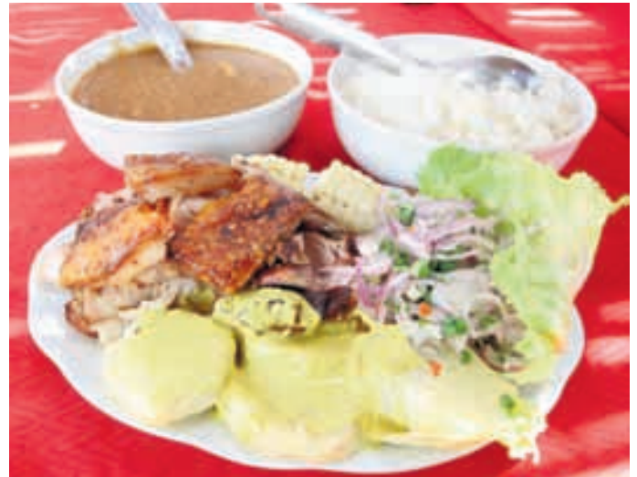
MENÚ. En el norte chico existen deliciosas alternativas para cada momento del día que pasan desde un contundente desayuno hasta un suculento almuerzo.