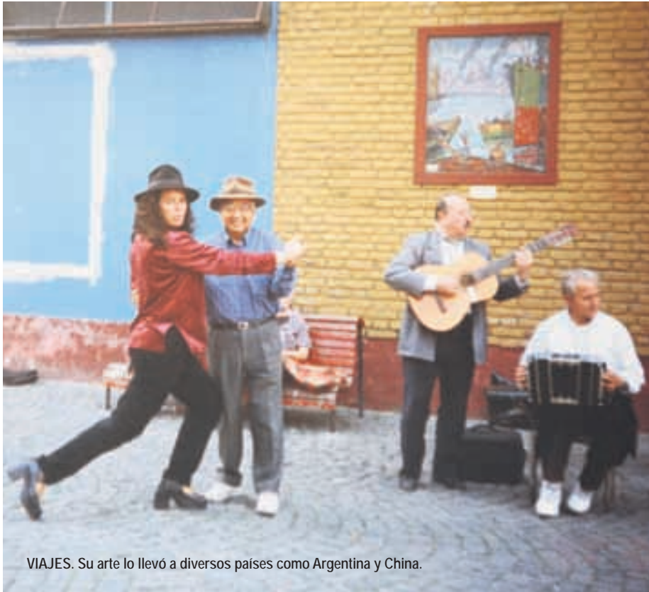
VIAJES. Su arte lo llevó a diversos países como Argentina y China.