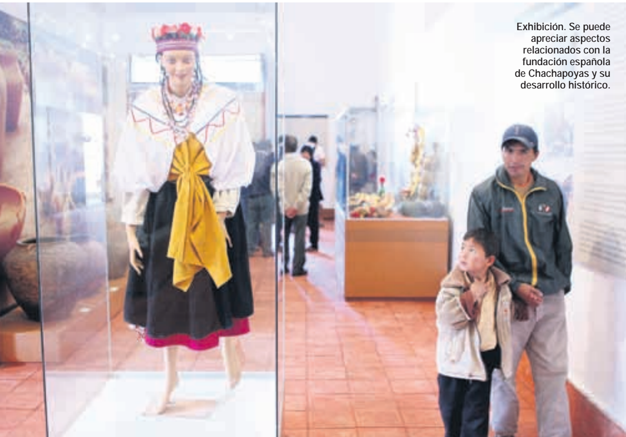
Exhibición. Se puede apreciar aspectos relacionados con la fundación española de Chachapoyas y su desarrollo histórico.

LA RECONSTRUIDA IGLESIA DE SANTA ANA, DECLARADA PATRIMONIO MONUMENTAL EN 1986, SEDE DEL ACTUAL MUSEO, ESTÁ EN LAS FALDAS DEL CERRO DE LUYA URCO, CASI CONTIGUA A LA IGLESIA DE LA MAMA ASUNTA; EN UNA PLAZOLETA QUE CONSERVA SU TRAZA INDÍGENA-COLONIAL.