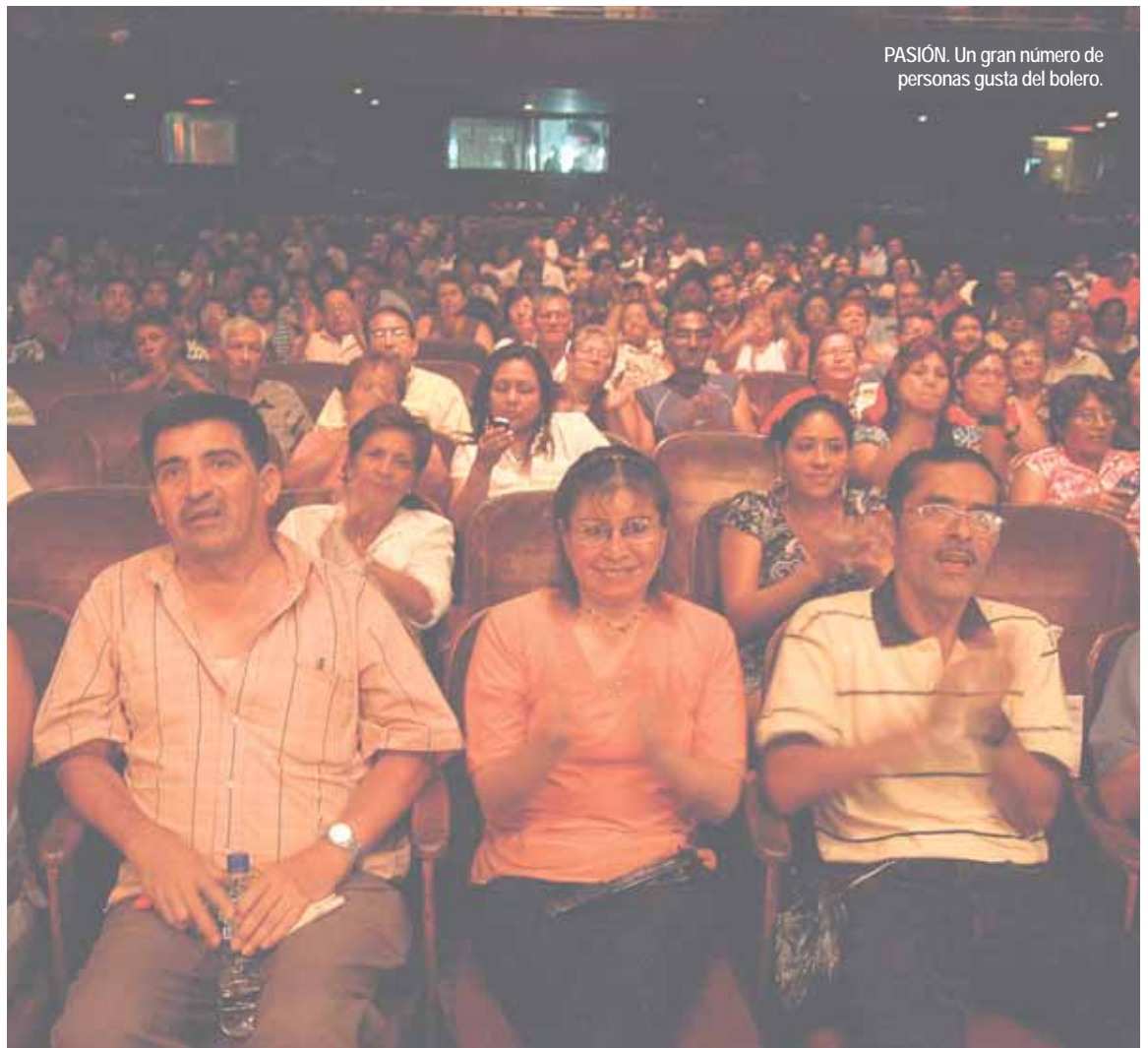
PASIÓN. Un gran número de personas gusta del bolero.