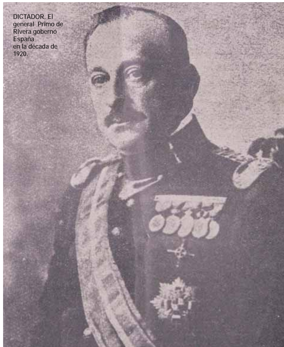
DICTADOR. El general Primo de Rivera gobernó España en la década de 1920.

Queda, sin embargo, subsistente el peligro de la desorganización. Luchar contra la monarquía y el militarismo aliados es difícil. Porque son fuerzas organizadas o afirmadas por la tradición y por el sistema de intereses que ellos representan. Derribar esas fuerzas supone, organizar vigorosamente las contrarias, usando de todos los medios de cooperación en una táctica amplísima de frente único. Esta táctica es bien difícil de comprender cuando la educación política de un pueblo no es muy honda. Aunque desde el punto de vista teórico sea fácilmente de-