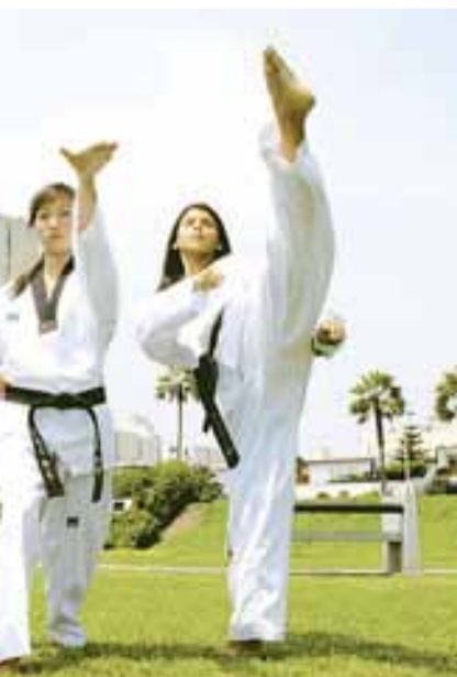
(que podría traducirse como combate imaginario).

EL TAEKWONDO ES UN ARTE MARCIAL PRACTICADO POR MILES DE NIÑOS Y ADULTOS, HOMBRES Y MUJERES. A DIFERENCIA DE OTRAS DISCIPLINAS, EL TAEKWONDO BUSCA QUE EL ALUMNO TENGA UN CONOCIMIENTO VIVENCIAL DE SU CUERPO, POSIBILIDADES Y LIMITACIONES; ASÍ COMO ALCANZAR UNA DISCIPLINA FÍSICA Y MENTAL.