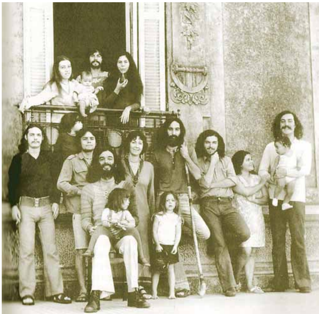
TODOS JUNTOS. Los Jaivas, de Chile, fueron uno de los primeros grupos que hermanaron el rock con los ritmos oriundos de América Latina. En la foto aparecen con los amigos y familiares con los que convivían en comunidad antes del golpe militar de 1973. Arriba, Los Speakers, héroes psicodélicos colombianos.

Corría 1965 y la situación era similar en el resto del conti-