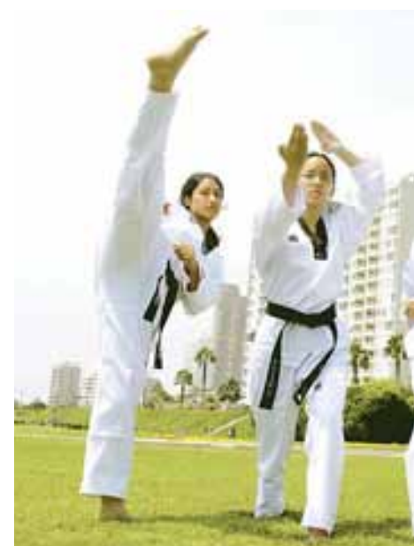
DISCIPLINA. Estudiantes realizan exhibición de poomsae.