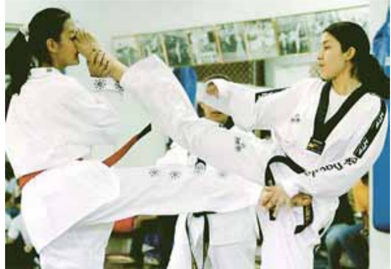
APRENDIZAJE. Alumnos hacen una demostración de patada al rostro durante un examen para ascender a cinturón negro.