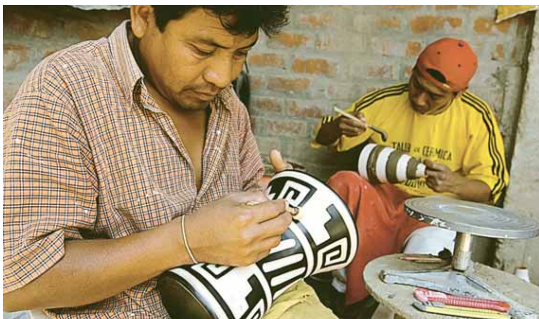
CHULUCANAS. El arte popular de los alfareros destaca por sus finos trabajos en cerámica de barro.

¿Los centros de producción de artesanías deben constituirse en lugares de visita para turistas? Por supuesto que sí. En otros países como México el turista además de comprar, dialoga con ellos.