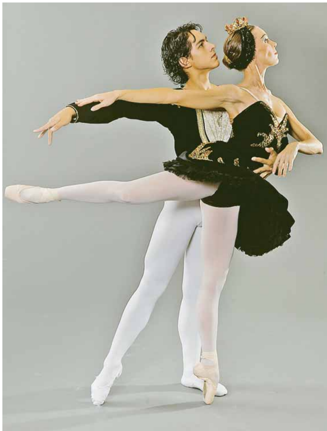
BALLET. Los protagonistas de esta danza clásica. Un espectáculo que deleita al público.

Cada vez que la temporada de ballet se perfila en el escenario de Lima, para el aficionado al arte que tuvo entre sus máximos exponentes a Pavlova y Nijinsky no puede faltar en esta cita uno de los clásicos que llevan la rúbrica del maestro Piotr Ilich Chaikovski.